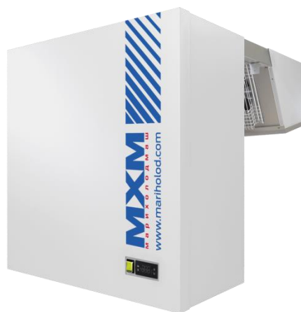
Таблица технических данных