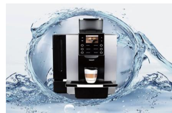
АВТОМАТИЧЕСКИЕ ПРОГРАММЫ ОБСЛУЖИВАНИЯ