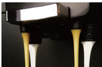
КОФЕ И МОЛОКО ОДНОВРЕМЕННО