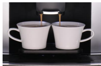
ПОДСТАВКА ДЛЯ ЧАШЕК ЭСПРЕССО